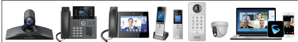
Dispositivos de Red Internos